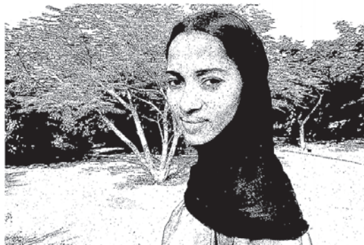
Jeune femme Targui, Tahoua Niger 1987